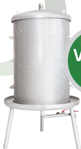
VS 200 preša