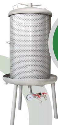
VS 70 preša

Preša je namjenjena prešanju muljanog grožđa, jabuka i drugog voća. Zajedno sa filter vrećom se preša može koristiti za filtraciju taloga. Za filtraciju je dozvoljeno koristiti samo tip filter vreće koju preporučuje proizvođač preše. Vreća nije u kompletu preše.