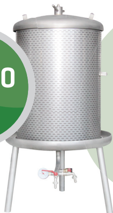
VS 150 preša